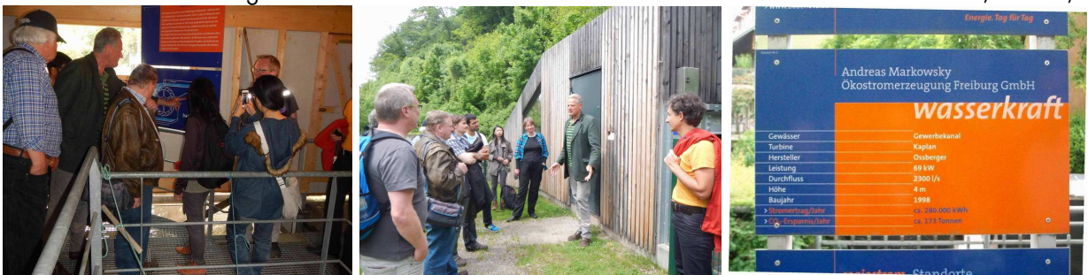
links: oberhalb des eingehausten Wasserrads. Mitte: eingehauste Wasserkraftschnecke am Kanal (ca 2010), re.: Tafel für Kraftwerk beim Gasthof Stahl , ab 1998, die Aggregate sind unterhalb des Wassers, weiter s.u.