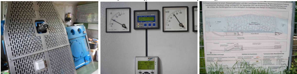
Getriebe und Generator, Stromerzeugungsanzeige, rechts: Draufsicht und Querschnitt sowie Förderer dieses Demonstrationsprojekts (1. Anlage dieser Art), hat sich nach Anpassungen gut bewährt, hohe Naturschutzaufgaben