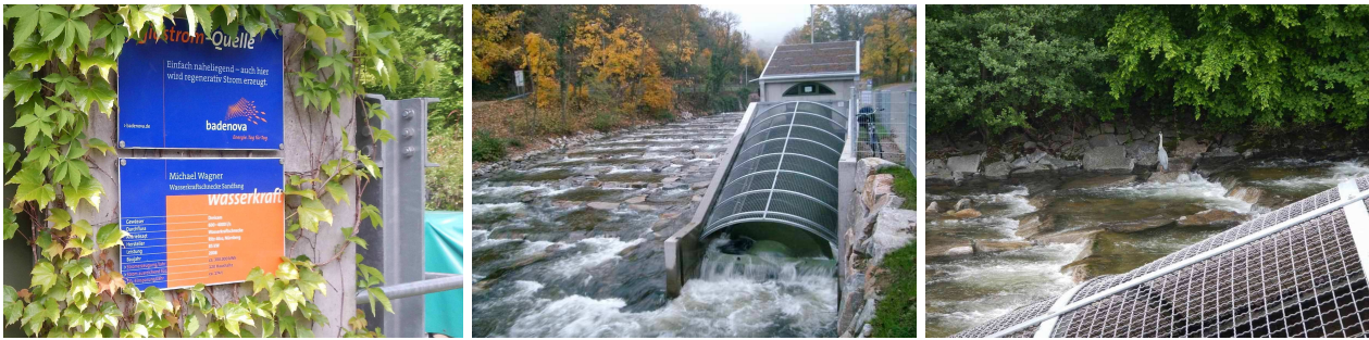
Wasserkraftschnecke an der Dreisam (seit 2008), Mitte: bei Vollast (2008), rechts: mit Fischreier