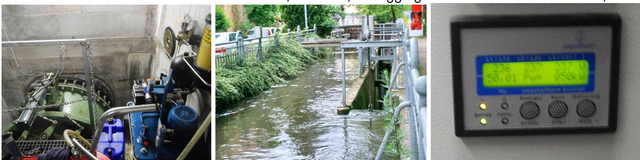
links: Kaplan turbine des Kraftwerks, Mitte: das Oberwasser mit Fischpassage (rechts), Stromerzeugungsanzeige