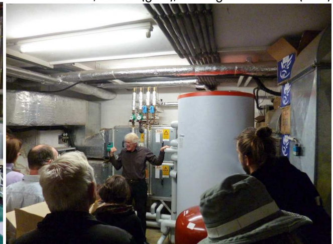
rechts: 900-Liter-Wärmespeicher im Keller-Nachbarraum