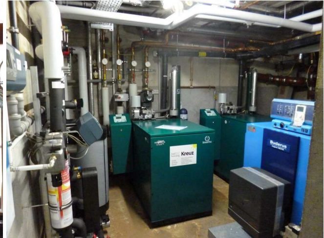
Doppel-Block-BHKW 2x5,5 kWel (grün), bisheriger Heizkessel (blau)