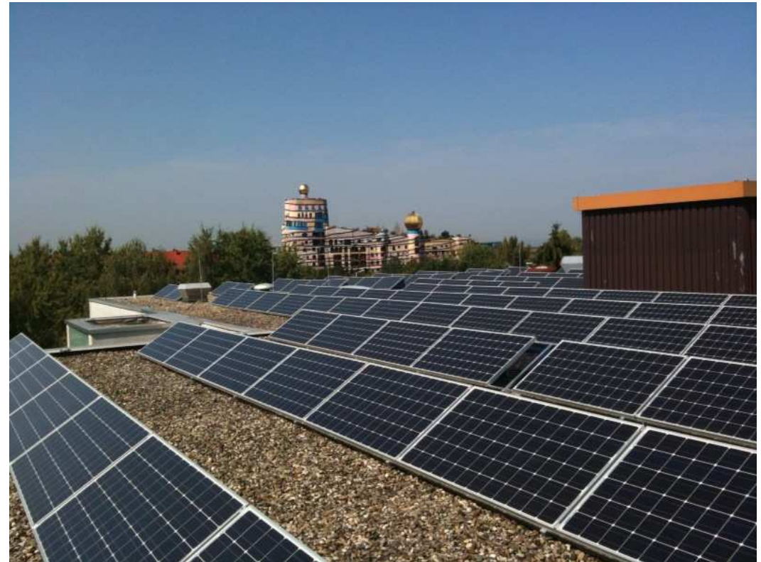
DaSol1, Darmstadt, Christoph Graupner-Schule

Erzielte Einspeisevergütung pro Jahr ca. 17 TEUR