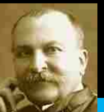
P. Sabatier - Nobelpreis 1912

Ökomethan aus Sonne, Wind und Bioabfällen