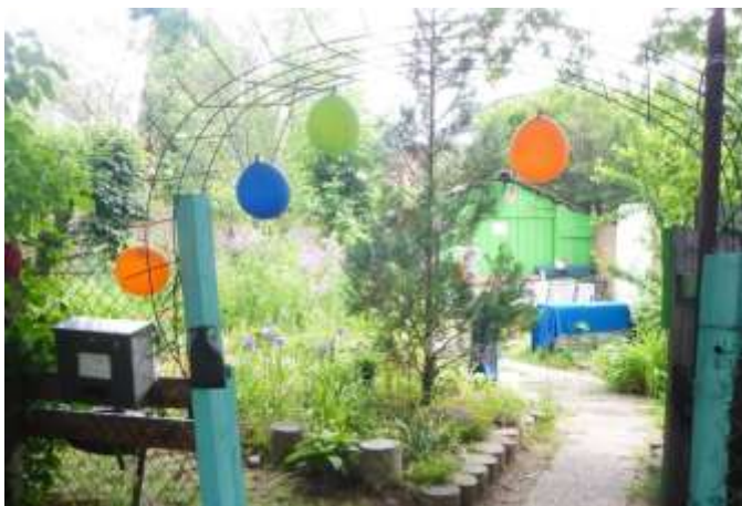
Eingang zum Lesegarten von Garten Leben Freiburg, Sundgauallee, geehrt als Projekt der UN-Dekade Biologische Vielfalt

Ein Kurzbericht von Thomas Wacker von Gartenleben Freiburg widmete sich der „Bedrohung der Kleingärten durch das geplante Neubaugebiet im Stühlinger“, den Aktivitäten des Gemeinderats dazu und den Chancen, Kleingärten zu erhalten. Die Führung im Stühlinger Westen machte Station zunächst im Lesegarten von Gartenleben Freiburg an der Sundgauallee und erkundete per Fahrrad das geplante Neubaugebiet samt die möglicher Güterbahnüberbauung.