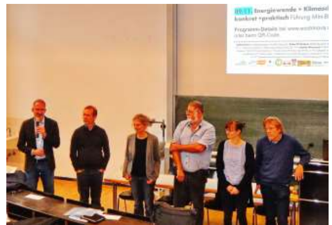
Anhörung von 6 Experten zu Energiewende-Klimaschutz am 23.11.2019