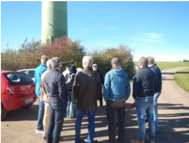
Windkraft-Führung in Freiamt/Krs Emmendingen mit Erhard Schulz vom Bundesverband Windenergie

Klimaschutz. Bürgerwindkraft. Windkraftpolitik. Power to X.“ Die Windkraft-Führung mit Erhard Schulz vom Bundesverband Windenergie LV Baden-Württemberg in Freiamt/Kreis Emmendingen bei Schönwetter auf dem Scheerberg und Tännlebühl fand ebenfalls guten Zuspruch.