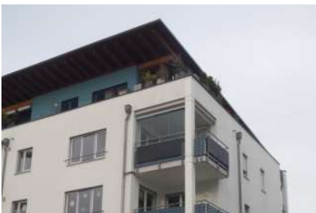
Besichtigte zweiseitige Balkon-PV-Anlage in Freiburg-Rieselfeld