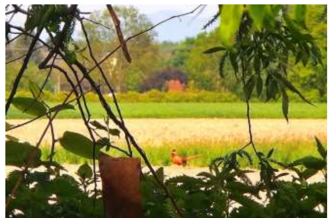
Fasan mitten in Dietenbach (Freiburg i.Br.) Mai 2019