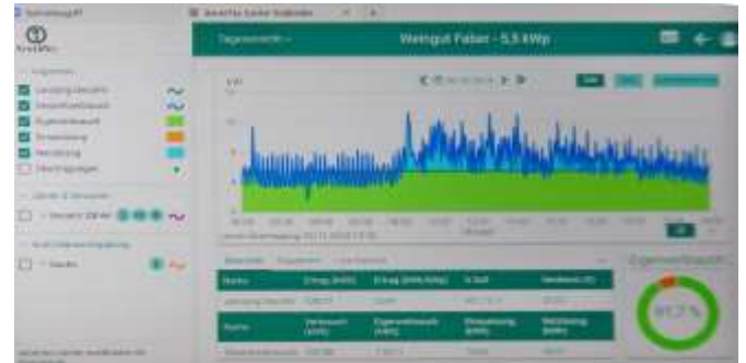
Bildanzeige des Mini-BHKW des Weingut Faber, Freiburg i.Br.