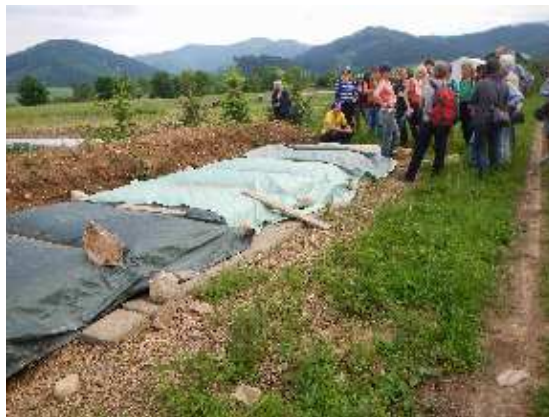
zu dessen Erdmiete