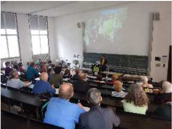
Von den Hörsaal-Vorträgen in der Universität