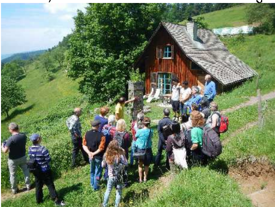
zum ersten Modell des Salatturms