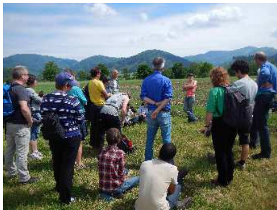
und Aussprache über die Arbeit und Erfahrungen

Das Permakultur Regiozentrum des Permakultur Dreisamtal e.V. entsteht seit Anfang 2014 auf dem Gelände des Häuslemaierhofs in Buchenbach und will erlebbar machen, wie durch Permakultur Bedürfnisse erfüllt werden und ökologischer Mehrwert erzielt wird. Mit Workshops, Seminaren und „Werkel-Wochenenden“ wird Permakultur („Dauerkultur“) einer breiten Öffentlichkeit verständlich gemacht und zusammen mit anderen die Zukunftsfähigkeit der Region mitgestaltet, http://permakultur-dreisamtal.de