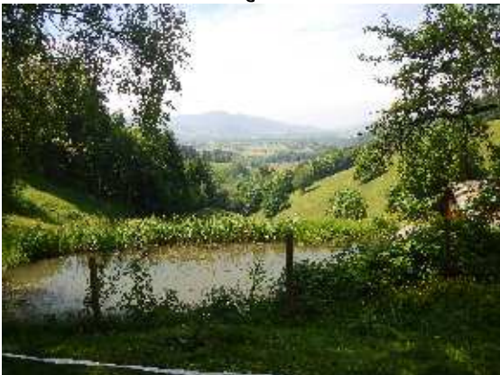
mit Bahn/Rad oder MFG zum Permakultur-Regiozentrum beim Häuslemaierhof /Buchenbach.