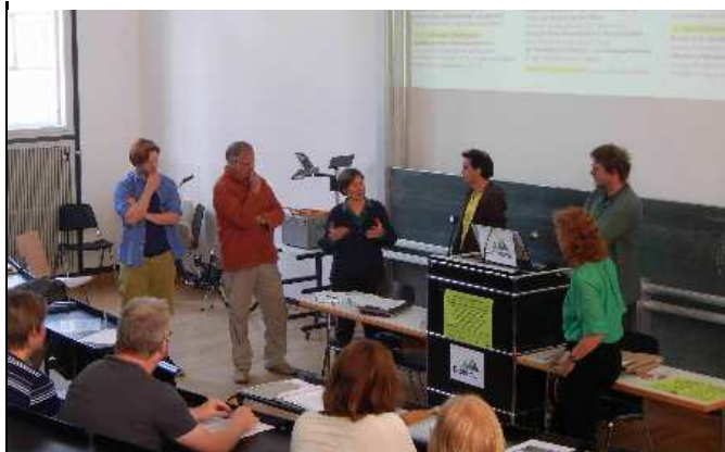
samt „stehender“ Podiumsdiskussion