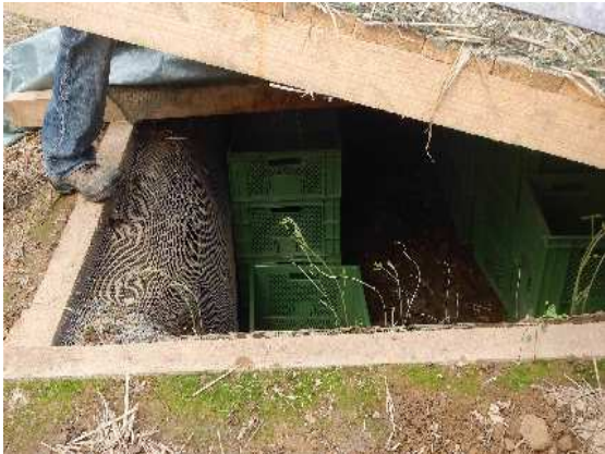
zur geöffneten Erdmiete