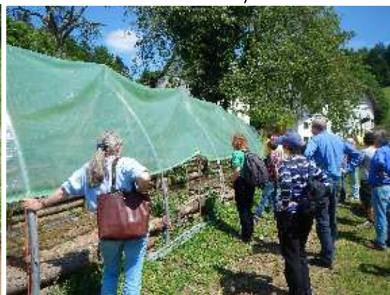
und zum Folientunnel für Tomaten