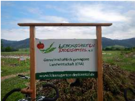
danach zum Lebensgarten Dreisamtal e.V.